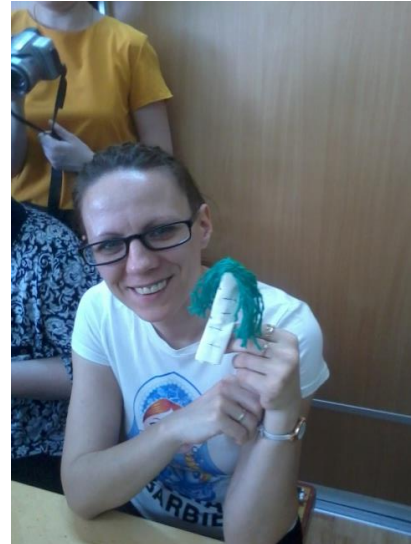
Члены родительского клуба "Семейная академия" знакомятся с технологией изготовления куклы народов Севера "Кукла -дерево Березка"