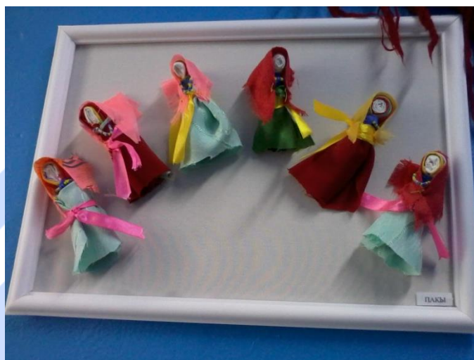
Куклы обско-угорских народов "Пақы "