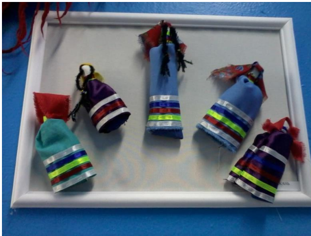
Куклы обско-угорских народов "Акань"